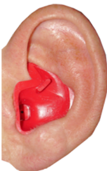
Afbeelding 1: Een goed ("snug")zittende Proplug, meteen klaar voor welke watersport dan ook!